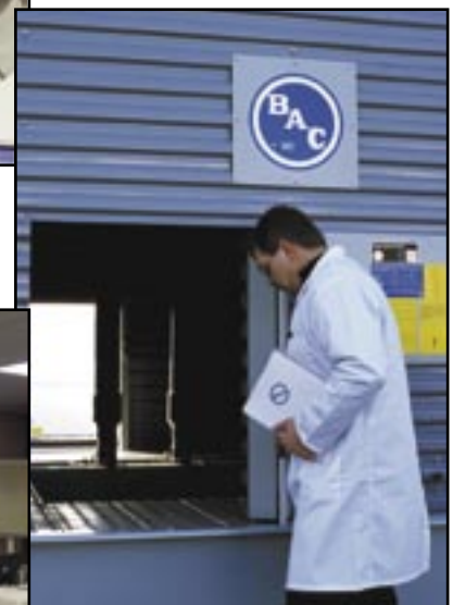
Inspection sur site