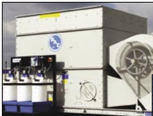
Installation avec poste de traitement