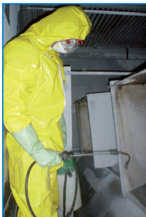
Operación de limpieza

Nota 1 : La limpieza mecánica de la torre, la balsa, la pulverización, las partes accesibles de la superficie, es efectuada dos veces al año según los procedimientos indicados. Conforme a las nuevas órdenes de aplicación para las instalaciones de enfriamiento que engloba el RD 865/2003, la operación de limpieza mecánica de las partes accesibles es el complemento de una limpieza química.