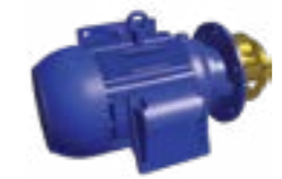
Sproeipomp zonder slakkenhuis*