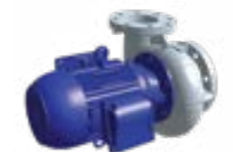
Sproeipomp met slakkenhuis